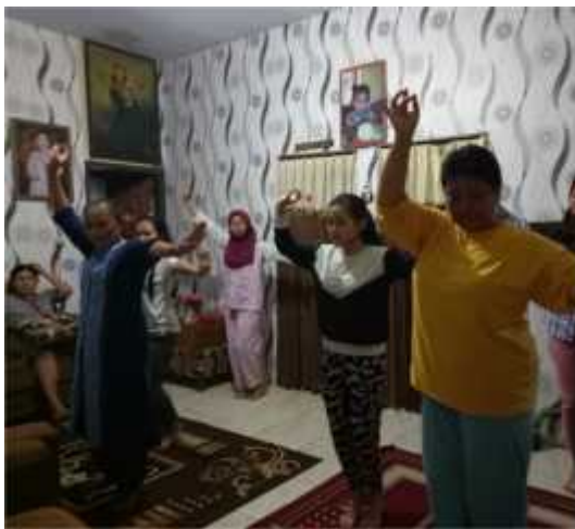
Gambar 4. Proses belajar tarian iringan cengklungan

microphone dengan benar, hingga menyusun formasi pertunjukan diatas panggung. Pengaturan alat- alat instrument cengklung dan formasi di panggung sangat penting karena akan mempengaruhi hasil pertunjukan kesenian cengklungan . Instrumen cengklung dan formasi panggung yang prima, tentunya akan menghasilkan performa maksimal serta pesan- pesan moral yang terkandung dalam lagu- lagu kesenian cengklungan dapat tersampaikan dengan baik. Sejauh ini, kendala yang dihadapi para seniman cengklung muda adalah banyak pemuda- pemuda yang merantau ke kota lain untuk bekerja, sehingga regenerasinya masih perlu digiatkan. Untuk tarian dan nyanyian, tidak banyak dilakukan perubahan karena lagu yang dimainkan saat pertunjukan masih sama.