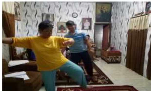
Gambar 2. Aktivitas belajar tari cengklungan

model pembiasaan yang umumnya bersifat alami dan tanpa pemaksaan. Pada fase tersebut, orangtua membuat anak terbiasa dan nyaman melihat, mendengar, dan merasakan hal- hal terkait kesenian cengklungan berada di lingkungan terdekatnya. Ketika anak merasa nyaman dan terbiasa, tentu ia tidak akan merasa asing dan lebih mudah menerima pelatihan. Pernyataan tersebut serupa dengan yang dikatakan oleh Mok (2011) bahwa tujuan seorang pendidik musik adalah membimbing siswa dengan nyaman untuk membangun minat dalam musik dan agar menghargai musik dalam hidup mereka.